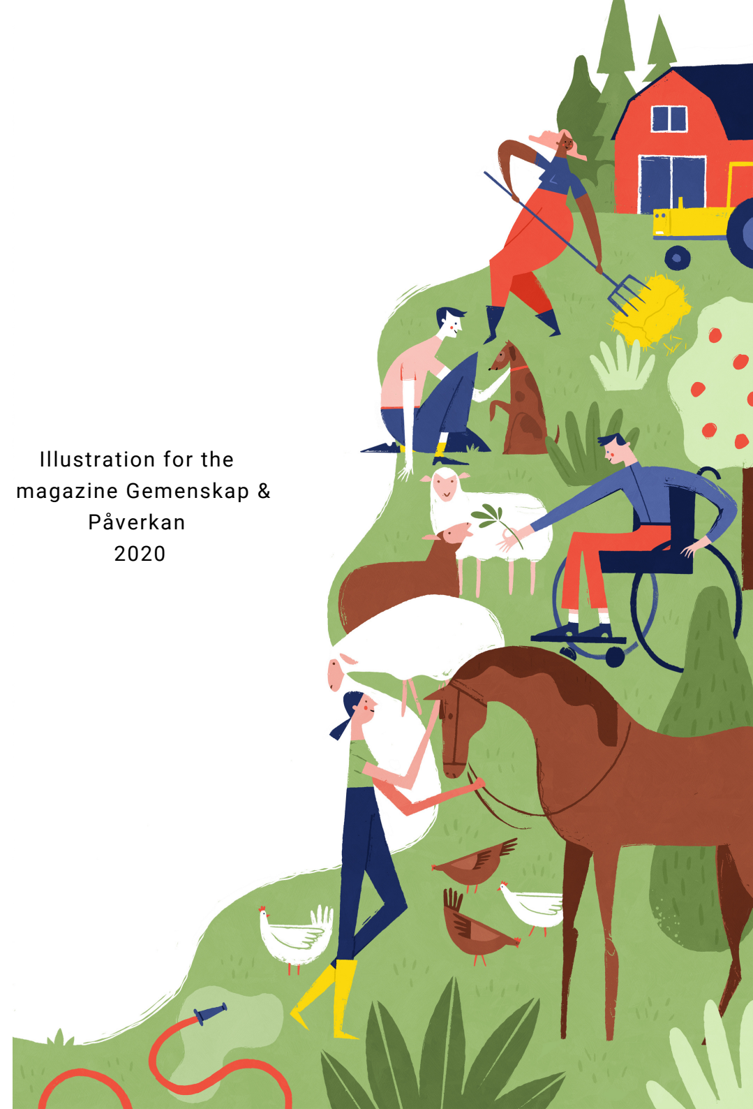
Illustration for the magazine Gemenskap & Påverkan 2020