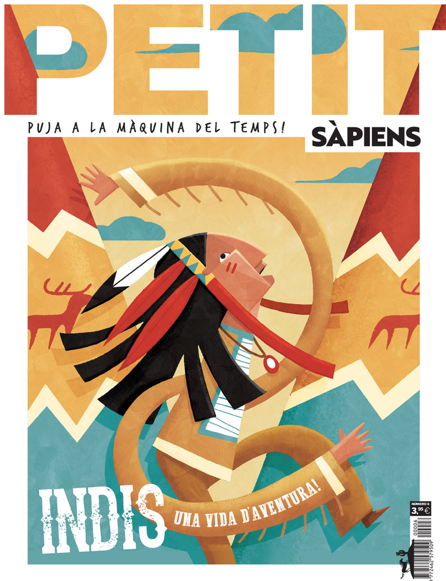
Cover illustration for the magazine Petit Sàpiens (The Native Americans) 2018