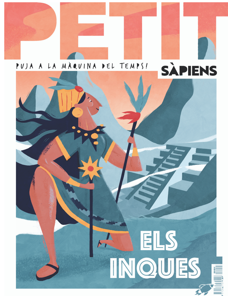
Cover illustration for the magazine Petit Sàpiens (The Incas) 2019