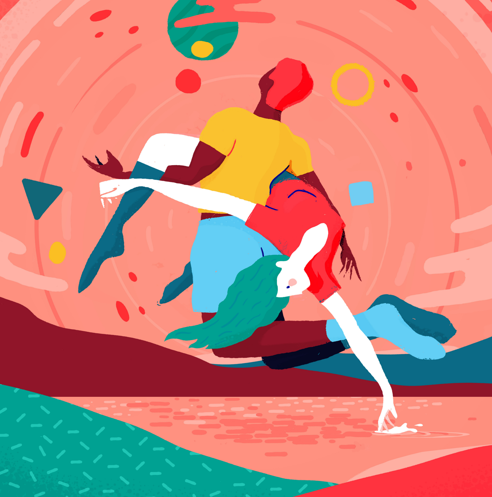
Illustration "Dancing with de universe" 2020