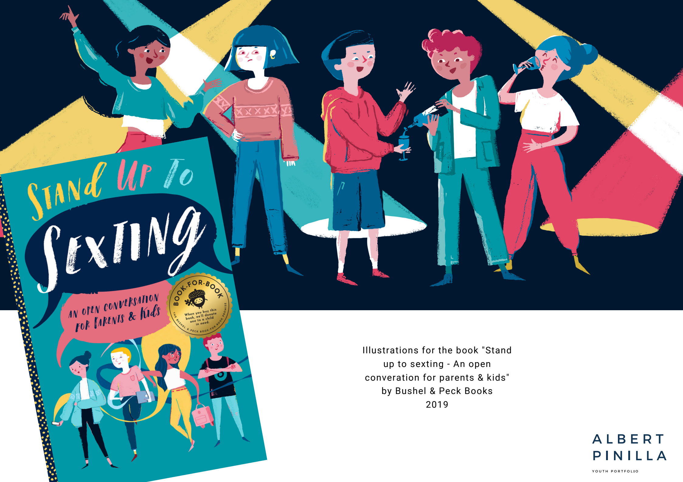
Illustrations for the book "Stand up to sexting - An open converation for parents & kids" by Bushel & Peck Books 2019