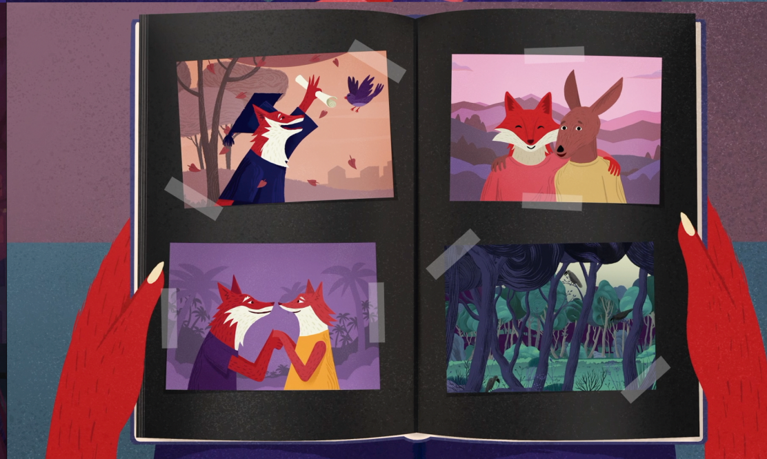
Music video for the song Wind Child by Anna Timgren. Animated by Ramón París. 2025