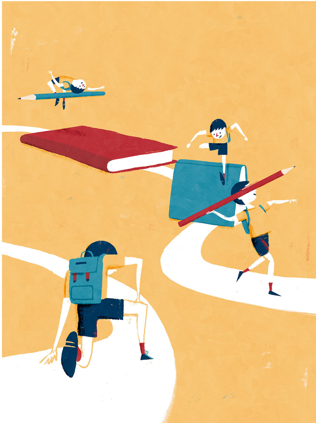
Cover illustration for the newspaper Diari de Sabadell (Back to school) 2019