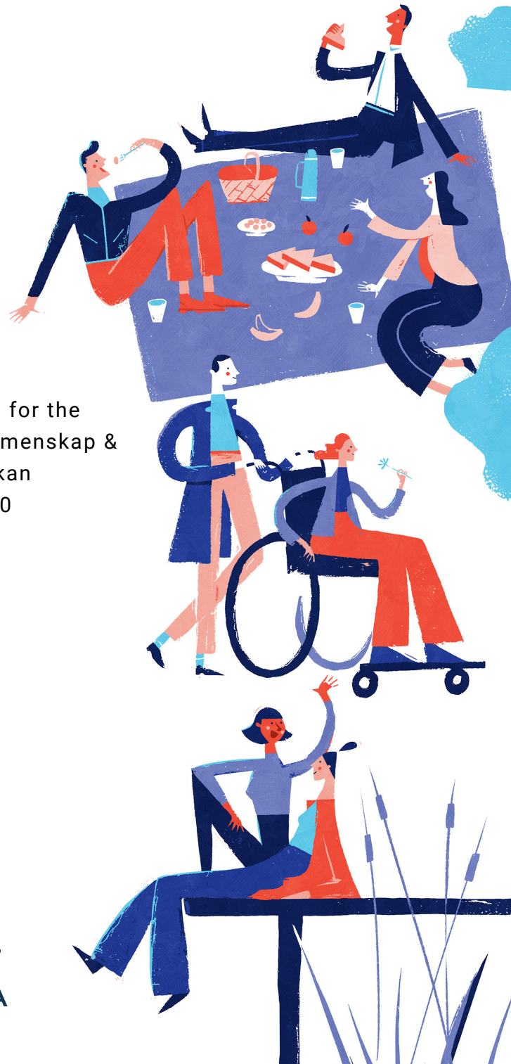
Illustration for the magazine Gemenskap & Påverkan 2020